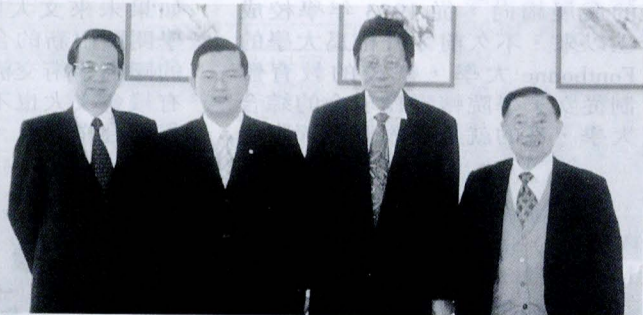
孫大千立委（左二）與董事長張鏡湖合影留念。

【本報訊】現任立委孫大千 3 月 18 日上午參訪中國文化大學，文大董事長張鏡湖特別帶領參觀校園，孫立委參觀了文大資訊中心、圖書館、校史室，以及華岡博物館等，行程中稱讚文大在各方面進步的腳步，已逐漸超越各大學，許多教學研究設施甚至都超越了國立大學；孫立委認為文大近年來的發展不斷地朝高科技邁進，可說是突飛猛晉。