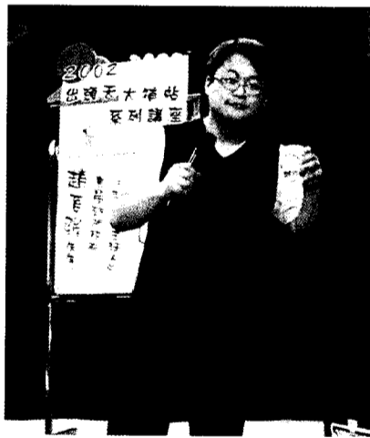
文大校友趙自強回母校談就業，指出應多元發展。

【記者劉仲瑄報導】知名演員、主持人、兒童劇場負責人，也是文大校友的趙自強先生 3 月 26 日現身文大，應文大畢輔組之邀，為求職就業的學弟妹指點迷津。短短一個小時的演講，儘管主題有些嚴肅，但仍然是整場笑聲不斷，充分顯示趙自強個人無限的魅力。