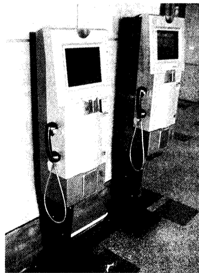
資訊中心將普遍設置校園生活資訊站，為同學的資訊查詢帶來無限便利。

陳館長表示，多媒體視聽中心共分六區，有傳統視聽區、小組視聽室、音樂欣賞區、多媒體隨選視聽區、小劇場和團體視聽室；其中，多媒體隨選視聽區是將教學研究成果及具有學術價值之各類型視聽資料整合，置於多媒體隨選視訊系統中，供讀者至視聽室觀看。陳館長進一步指出，各種類型的視聽資料都可以在小劇場內以單槍投影機及六聲道立體環繞音響的方式播放，劇場前方活潑的半圓型舞台設計及亮麗的燈光可做為表演及作品發