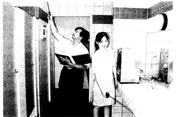
文大校園配合台北市政府實施反偷拍工作。