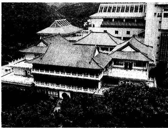
隱逸山林間的文大校園，所有館樓充滿著古典而賦現代味的風格

大忠館興建完工於民國六十六年六月，為一座中國傳統宮殿式建築，外觀主體為純白色建築高達七層，屋頂則為四角重簷尖頂，覆以黃色琉璃瓦，配上朱紅色壁柱，色彩鮮明。其中設有美輪美奐的華風堂，只要校內有大型活動要舉辦，都會選擇在空間寬敞、環境舒適的華風堂舉行。