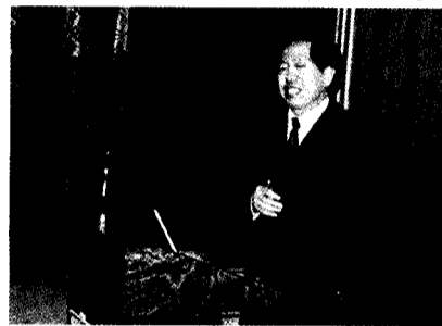
國安局蔡得勝將軍在文大，為來自全國八所學校教官進行演說。

推廣部推出專業諮詢服務，請電洽：(02) 2700-5858 轉遊學組分機 581-588；免費專線：0800-212-862。