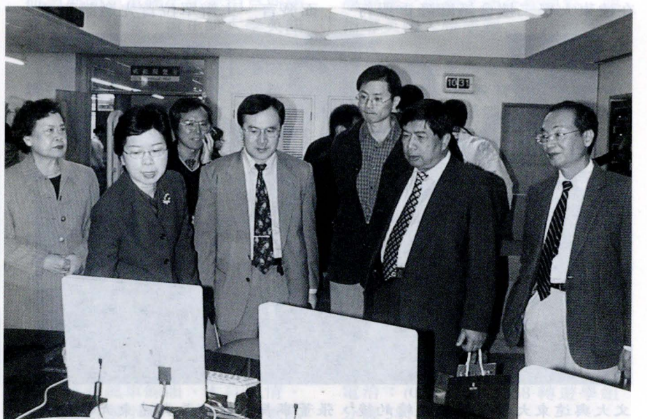
日本校友欣見母校成長，對圖書館走向影音多媒體的情況，表示肯定。