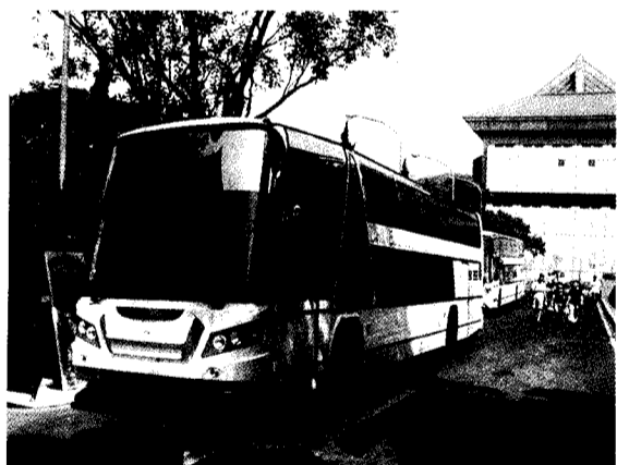
文大校車提供師生租車服務，歡迎師生多利用。

耀感。不僅可利用每次文大學生出遊的機會，為文大宣傳，也可以凝聚文大師生的向心力，這是多贏的局面。他也呼籲文大師生應多加利用文大校車的這項服務。