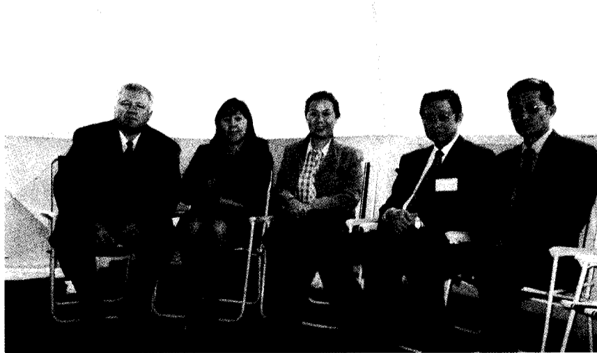
張董事長與來自東北亞各國大學董事長、校長等代表交換教育理念，並在遊艇上合影。