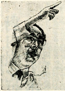
名指揮家董麟 楊達尊繪

在典禮中首先由中華學術院院長張其昀博士致詞說：我代表中華學術院頒贈哲士學位給董麟先生，感到非常榮幸，同時我也說二句話表示敬意；第一句話是董先生以中國人為榮，中國人也以董先生為榮。因為董先生認為在文化復興聲