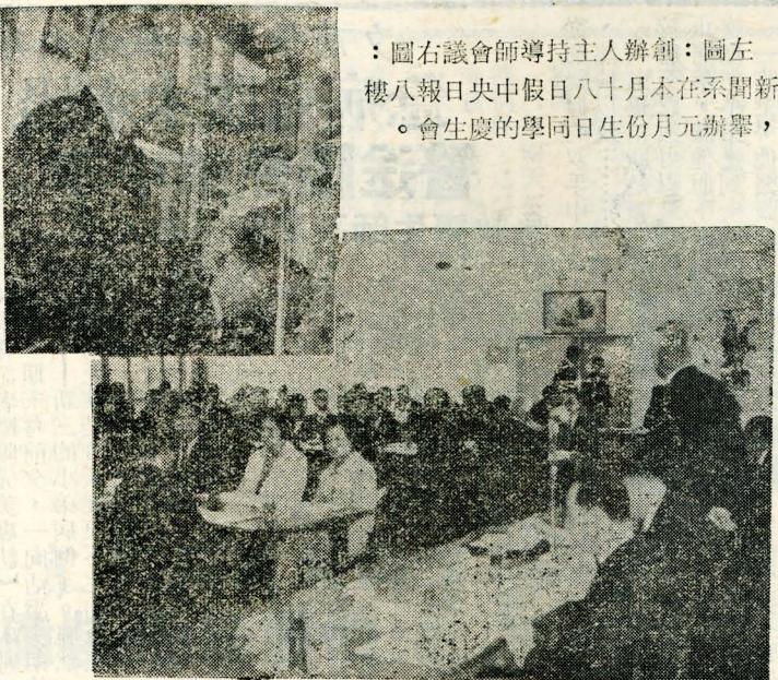
：圖右議會師導持主人辦創：圖左 樓八報日央中假日八十月本在系開新 。會生慶的學同日生份月元辦舉，

(附錄二) 華岡育英會捐款表彰辦法民國五十八年一月 一、各項獎學金均得冠以捐款人之姓名，或用其所指定之名稱。 二、凡捐款在新臺幣壹萬元者，均致贈「樂育英才」獎狀。 三、捐款在新臺幣伍萬元以上者，得以學生宿舍一間(齋)冠其名。 四、捐款在新臺幣拾萬元以上者，得以辦公室一間(齋)冠其名。 五、捐款在新臺幣貳拾萬元以上者，得以教室一間(堂)冠其名。 六、捐款在新臺幣伍拾萬元以上者，得以圖書館閱覽室(堂)冠其名。 七、捐款在新臺幣壹百萬元以上者，得以建築物之一翼(樓)冠其名。 八、捐款在壹百萬元以上者，得以整座建築物(館)冠其名。 (附錄三) 我國財政部對個人及營利事業捐款教育文化事業免稅之現行獎勵辦法 甲、綜合所得稅：有關國防、勞軍、及對於教育、文化、公益、慈善機關或團體之捐贈，以捐贈總額不超過綜合所得稅總額百分之廿為限(所得稅法第十七條一項三款之(一))。 乙、營利事業所得稅：前項捐贈，除協助國防建設慰勞軍隊者，以不超過所得百分之卅為限。