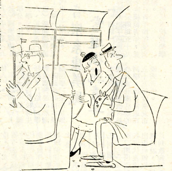
「處好點一沒執爭掌車跟，你過訴告早」：說太太

二翁慧表示：「她的個性，讓人捉摸不定，且一反一般影片中，女主角奢華的打扮，扭捏作態的整扭。本片，所力求表現的，該是人物的寫實及內心的激盪。」（梅）