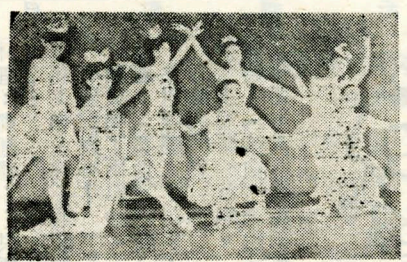
柔美的和美的——專為同學們練習加強舞姿的臨場表演。

據悉，假如您在圖書館裏見了一篇愛不忍釋的文章，可以拿至櫃檯使用影印機，付很少的代價即可擁為己有。