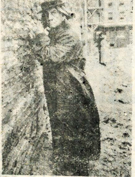
↑ 着「沒膝」裙之父 膝先蹲生