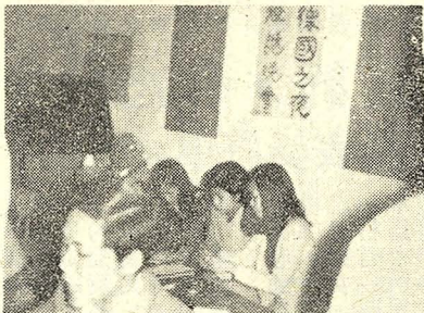
本週一晚上「德國之夜」活動，由「德國之夜」發起，為「德國之夜」活動。

【本報訊】華岡華局將於四月中旬出版一套新書。書名是中國政治思想史第一至第六冊，為蕭公權先生所著，全套定價為一五五元，並以八折優待本校同學。