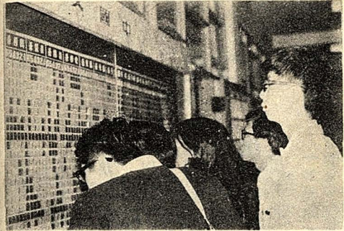
表課功覽閱相爭子學岡華△