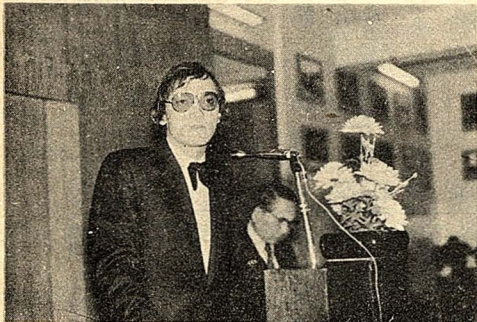
△德講國學人萬圖(左)與伯文、李雲、華岡、作學術

這次晚會由學生生活活動中心主辦、吉他社協辦。晚會中有電子琴演奏，吉他獨奏、合奏。歡迎愛好音樂的同學前往欣賞。