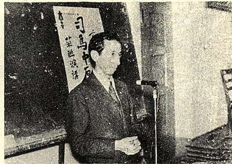
作家司馬中原昨晚蒞校演講 (本報記者鍾強國)