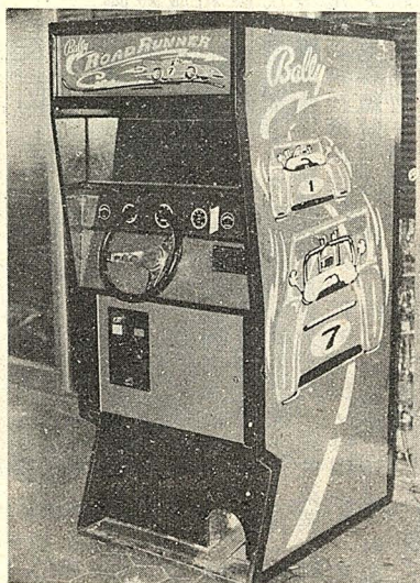
大汽車(恩駕報)館一樓近添置形

此次演講比賽題目為「青年的責任」演講時間為三至五分鐘，並分為系內及系外兩組，而分別錄取前三名，並備有優勝者獎品，如欲報名參加者，可至日文組辦公