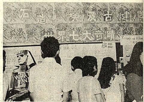
建築系二年級大義館展覽之盛況