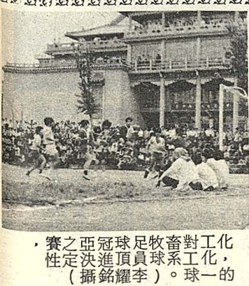
化的，對工球，畜牧，足球，冠軍，亞進，定之，賽性。