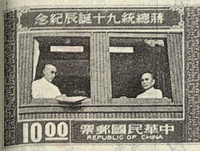
日一十三月十年五十六國民

倫敦版帆船郵票發行於民國二年，雖以帆船為主，但其背景以火車和鐵橋所構成，該票為中國最早的火車郵票其後並有老北京版及新北京版票等，其他尚有加蓋票，品目太多，無法於一時之內集全故未展出。