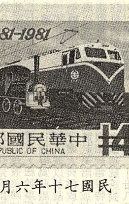
日九月六年十七國民

政府為有效的管理及輔導工商事業，舉行「工商普查」，於民國六十六年發行「工商普查郵票」，並包含交通事業，其中火車所佔位置不甚明顯須仔細觀察。