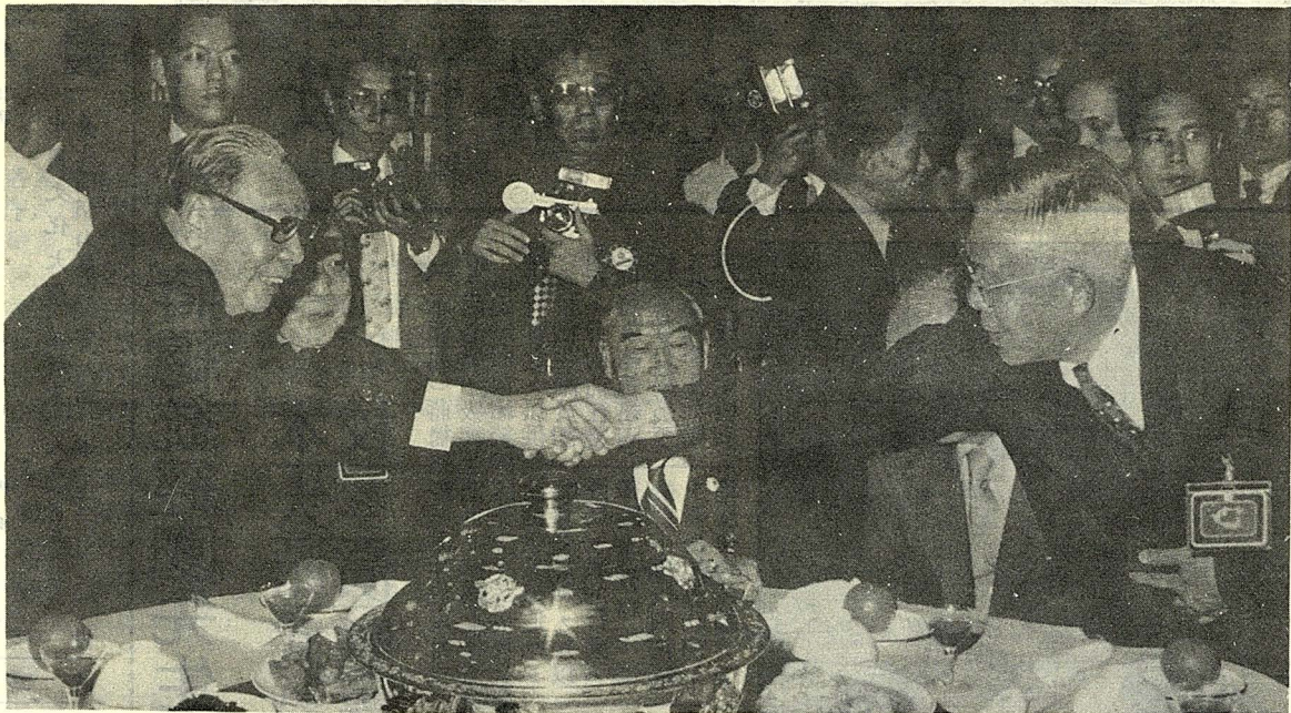
第一屆國民大會第六次會議於陽明山中山樓舉行，會後餐敘蔣總統經國先生與本校張故創辦入握手。